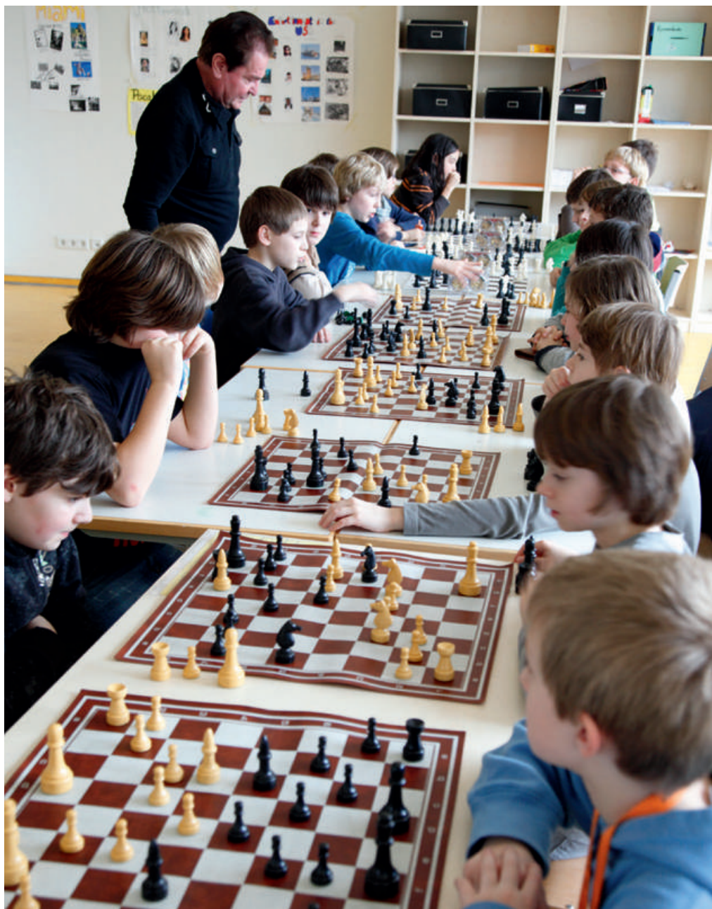
Ein Thema der Schulkonferenz: Die Einrichtung von Ganztags- und Betreuungsangeboten