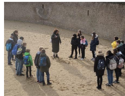
APX Klasse 6