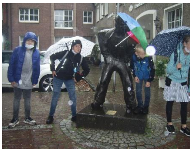
Stadtspiel in Rees Klasse 5

Die für die Erprobungsstufe geplanten Wandertage greifen den Gedanken des gemeinsamen Erlebens und der Teamentwicklung in unterschiedlichen Aspekten auf.