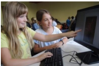
Umgang mit digitalen Medien