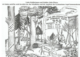
Tag der offenen Tür