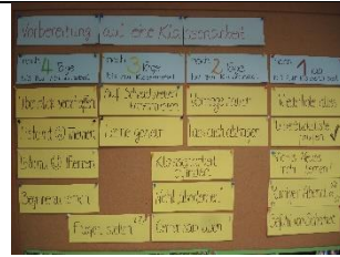
Methodentage „Lernen lernen“