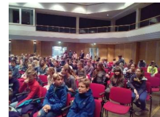
White Horse Theatre