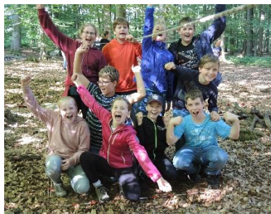
Naturerlebnisschule Raesfeld Klasse 6