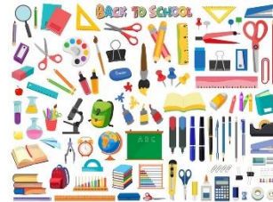
Schulbücher und Materialien