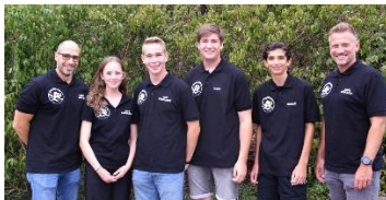
Aktionen der SV